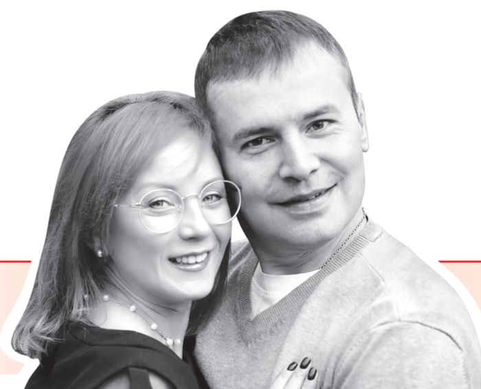
СЕМЬЯ, РОДИТЕЛИ ЧЕТЫРЕХ ДЕТЕЙ